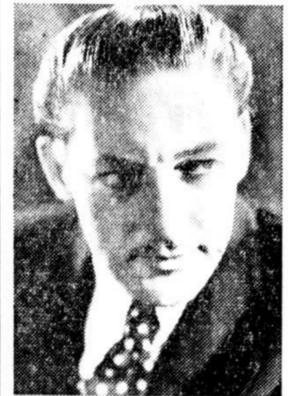
Warren William som fyrstikkongen Paul Kroll.

En filmatisering av skronen om Kreuger og Greta Garbo.