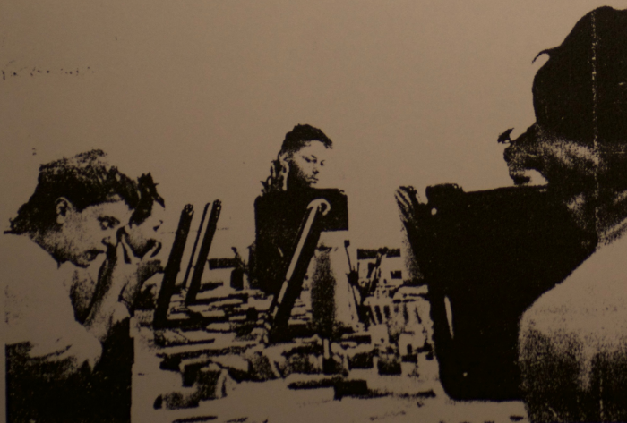
Sminkgruppen – med flere deltagere från Borgå – jobbade flitigt under veckoslutets teaterdagar i Esbo. Vid avslutningen demonstrerades olika masker.