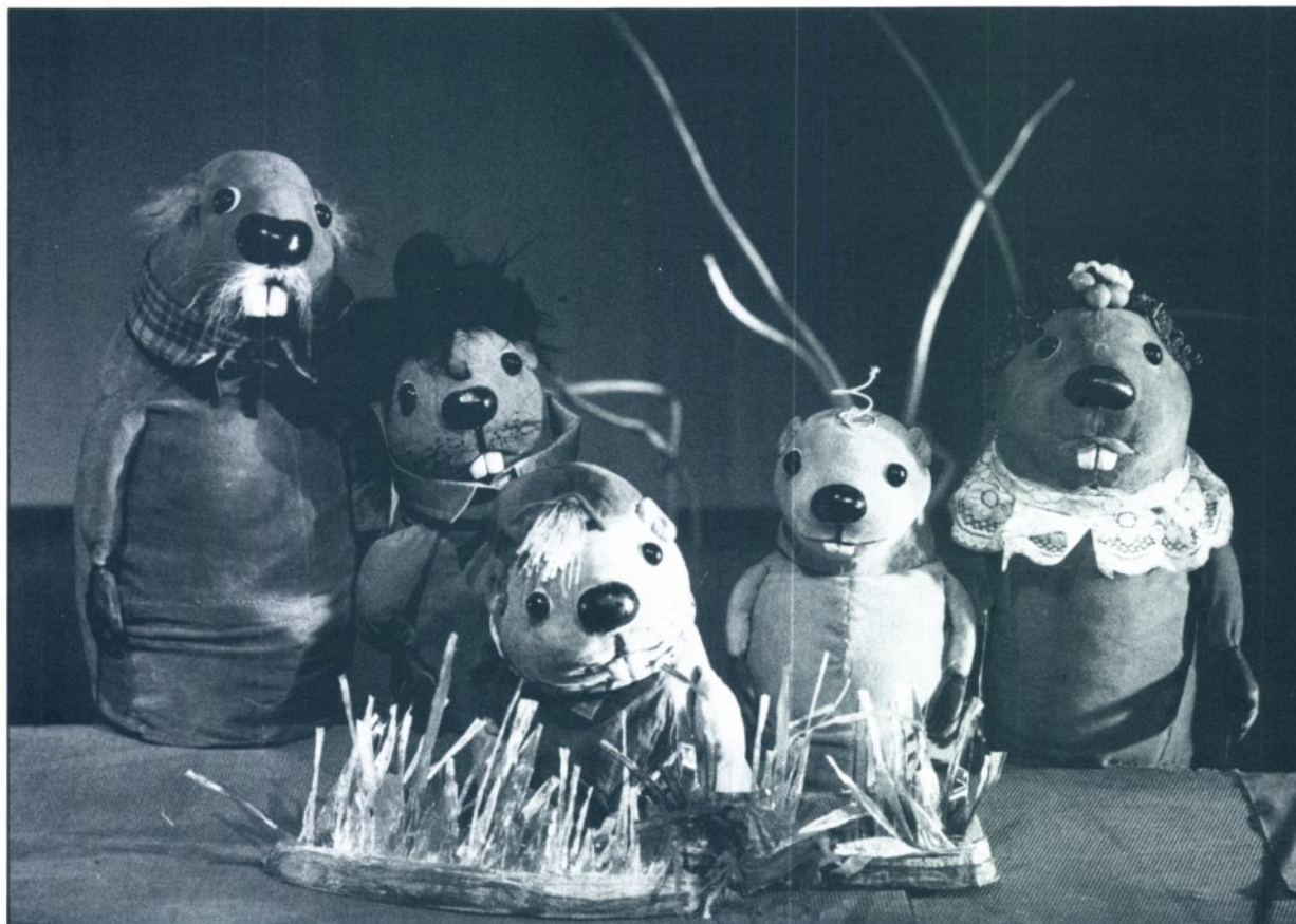
Her er hele familien Bever samlet: Fra venstre: Far Bever, Storebror Bjarne Bever, Benjamin Bever (foran), Lillebror Bever og Mor Bever.