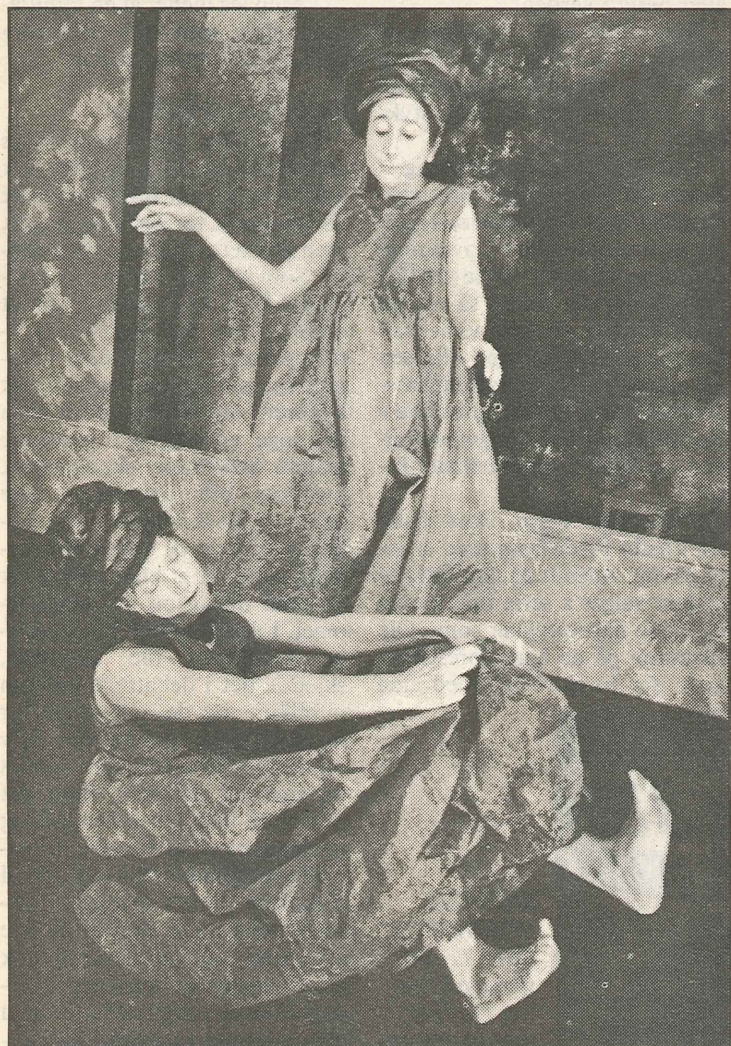
SELVNYTTENDE: Mye bra i «Øglens frise», men dessverre var ikke forestillingen gjennomarbeidet nok, og i blant var de to aktorene så selvnyttende at opplevelsen ble estetisk tilfredsstillende, men innholdsmessig fattig.