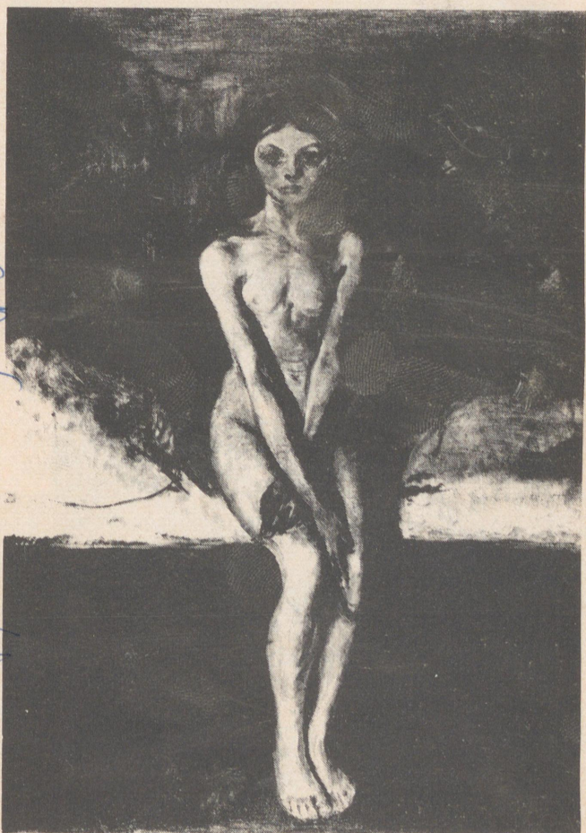
Edvard Munchs «Pubertet» fra 1889.