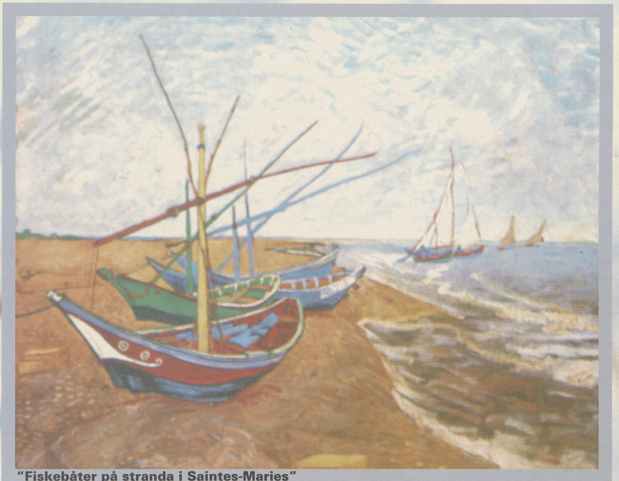
"Fiskebåter på stranda i Saintes-Maries"