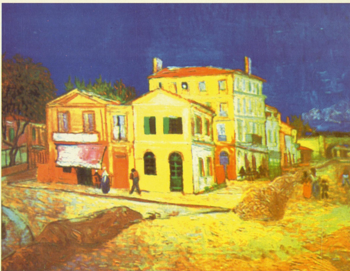
"Det gule huset" (van Goghs hus i Arles)