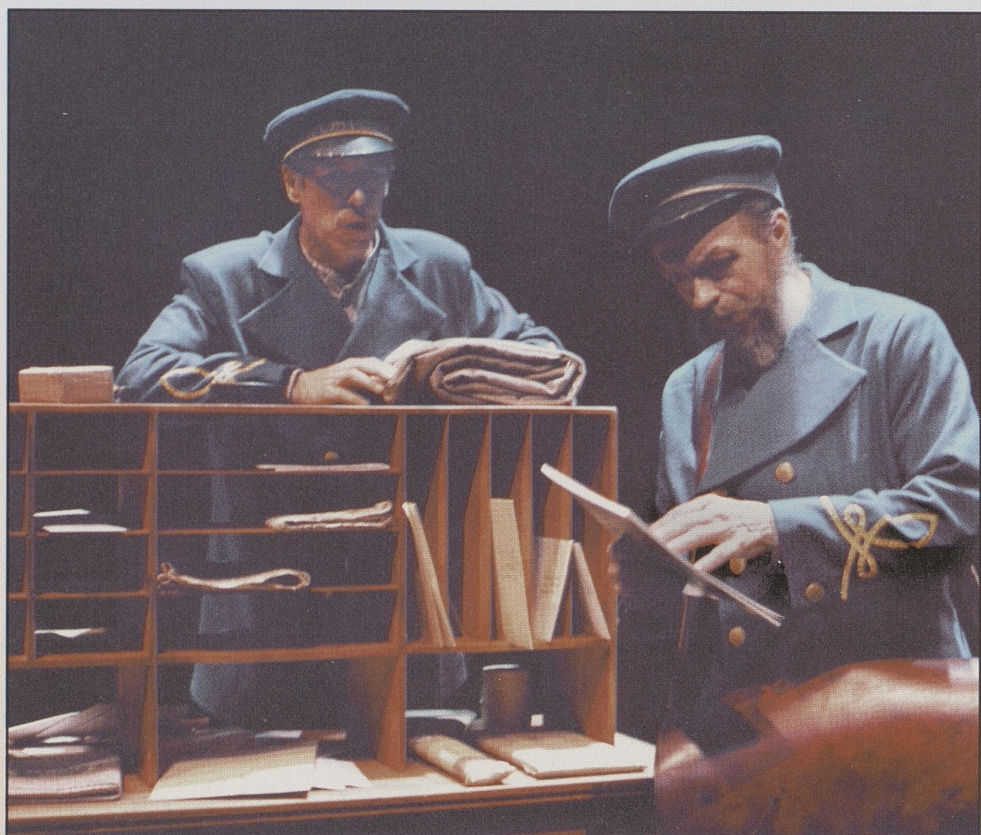
NB Rana Depotbiblioteket