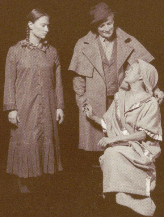
Hilde Dr. Wangel Ellida Wangel