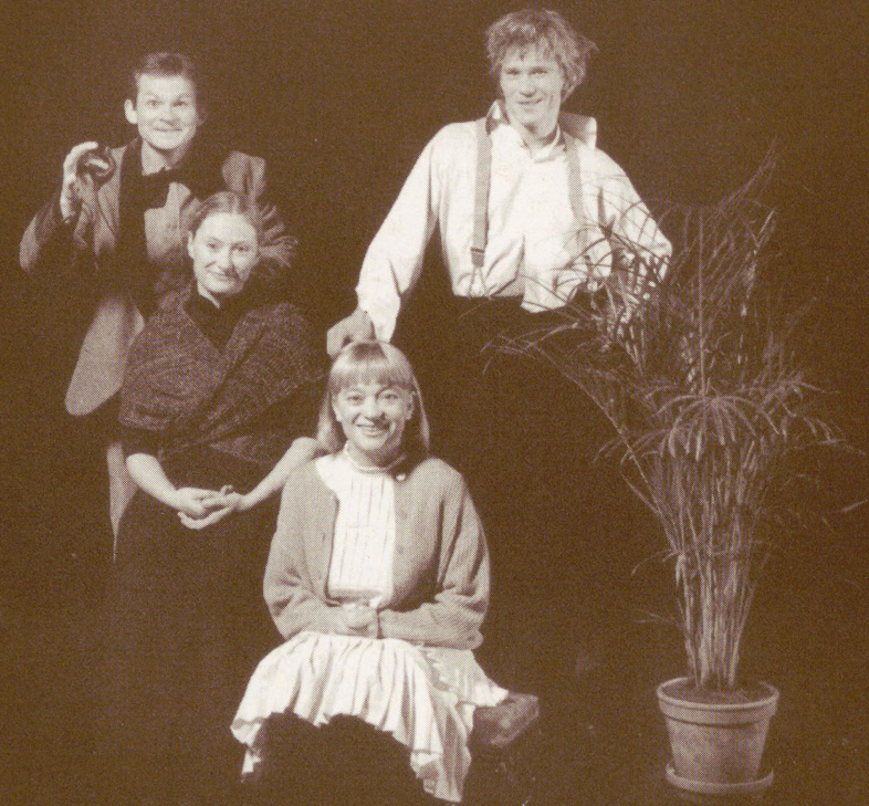
Hjalmar Ekdahl Gina Ekdahl dr. Relling Hedvig

I «Et dukkehjem» fra 1879 møter vi Ivar, Bob og Emmy Helmer; Nora og Thorvalds tre barn. Faren er blitt banksjef, så familien har råd til å holde barnepike Anne Marie i sitt brød. Husvennen dr. Rank har også sin faste gange hos Helmers, og fremtiden ser i det hele tatt lys ut. Men akk... Moren har en gang skrevet falskt for å skaffe penger til behandling av sin manns livstruende sykdom, noe Thorvald ikke vet noe om. Dette er nå i ferd med å komme for dagen. Moren håper innerst inne på det vidunderligste, at ektemannen skal ta på seg skylden. Stykket slutter med at Nora forlater hjemmet.