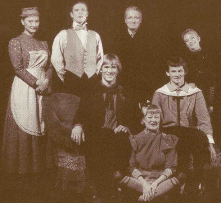
Anne Marie Thorvald Helmer dr. Rank Nora Helmer Ivar Emmy Bob