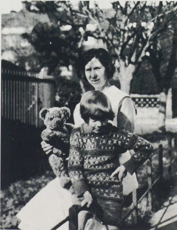
Christopher Robin, Ole Brumm og barnepiken.