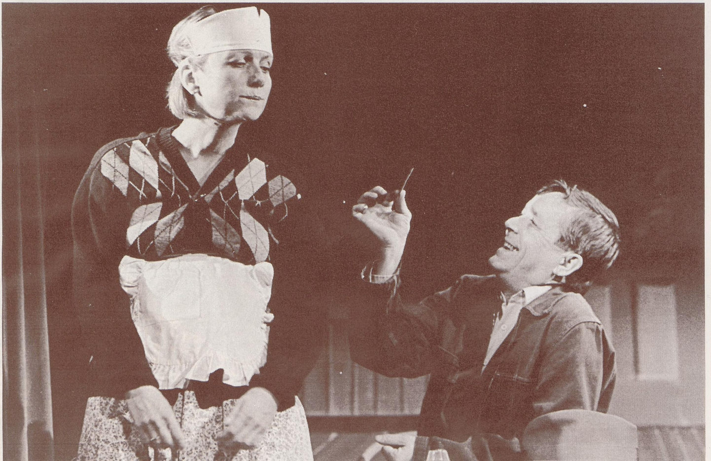
«En halv pils»