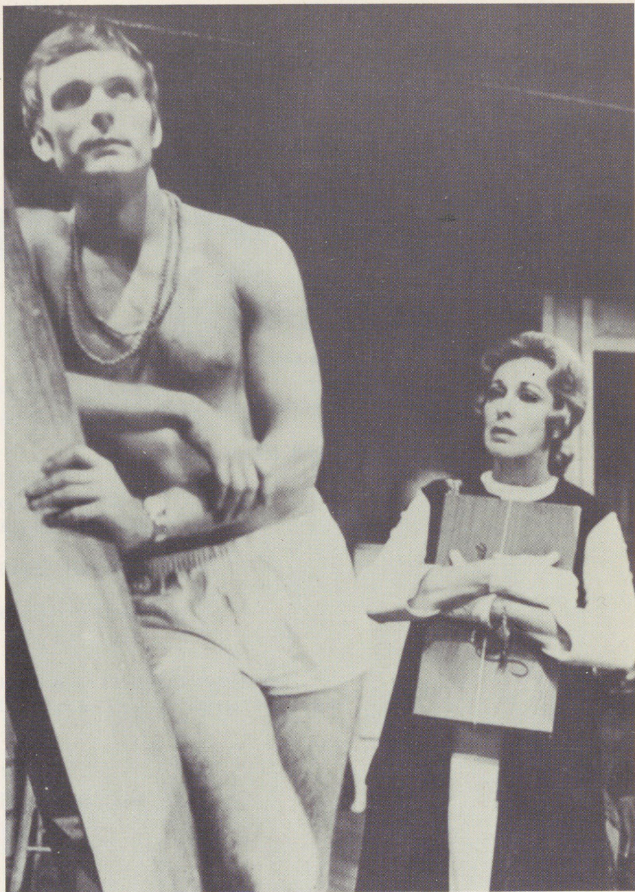
Fra Broadway-oppførelsen. Keir Dullea som Don Baker og Eileen Heckart som Mrs. Baker