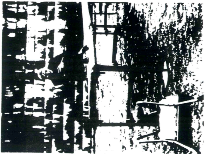
DET MOTSATTE PROSJEKT VISER FORESTILLINGEN VELLYSTENS TILFLUKT I KAMPEN VANNRESERVOAR 1.2.7.8.9.14.15.16. SEPTEMBER KL. 20.00