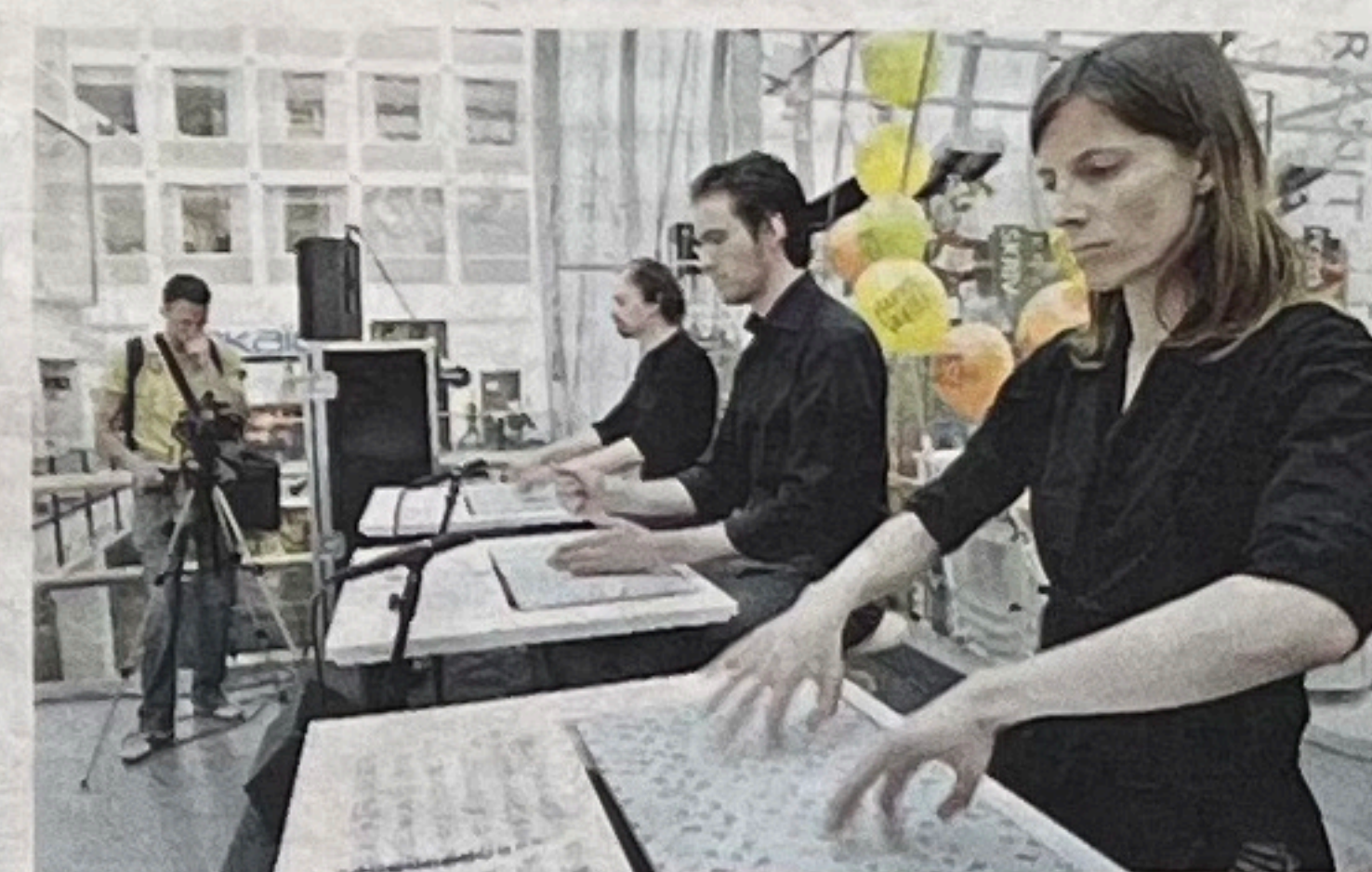
LYD FOR KAFÉBORD: Ning framfører «musikk for kafébord».