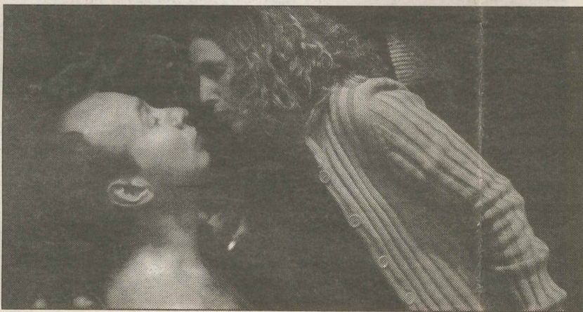
Gjenkjennelse gjennom det absurde på Den Nationale Scene.

«Those were the days», synger familien som har fått et sjeldent anfall av uforfalsket lykke. De mimrer om huset ved havet og hvor fint alt engang var.