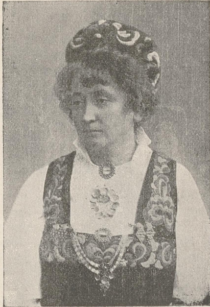
Fru Hulda Garborg.