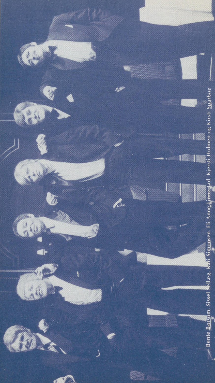
Bente Børsum, Sissel Sellæg, Kari Simonsen, Eli-Anne Jimmesdahl, Kjersti Holmen og Kirsti Sparboe