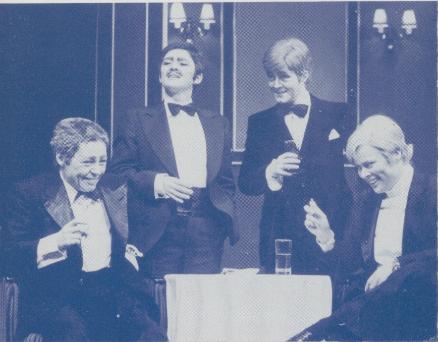
Kari Simonsen, Kirsti Sparboe, Kjersti Holmen og Eli-Anne Linnestad.