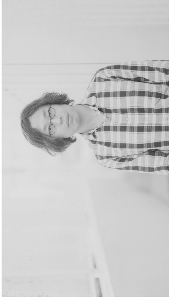
Toshiki Okada

Oslo Internasjonale Teater produserer jamleg dramatiserte lesingar av internasjonal samtidsdramatik som ikkje har vore omsett eller spelt i Noreg tidlegare. OIT er eit tilbod til dei som er interesserte i samtidsdramatik og ønskjer å oppdage nye dramatikarar og skodespel, anten det er teater, frie grupper eller teaterskapparar på uttikk etter stykke å setje opp, dramatikarar som ønskjer inspirasjon til sitt eige arbeid eller vanlege teaterpublikummarar som ønskjer å sjå nye verk. Vi har eit breitt, internasjonalt nettverk som vi brukar i arbeidet med å oppdage dramatiske verk. OIT vert drive av det internasjonale teaterkompaniet Imploding Fictions.