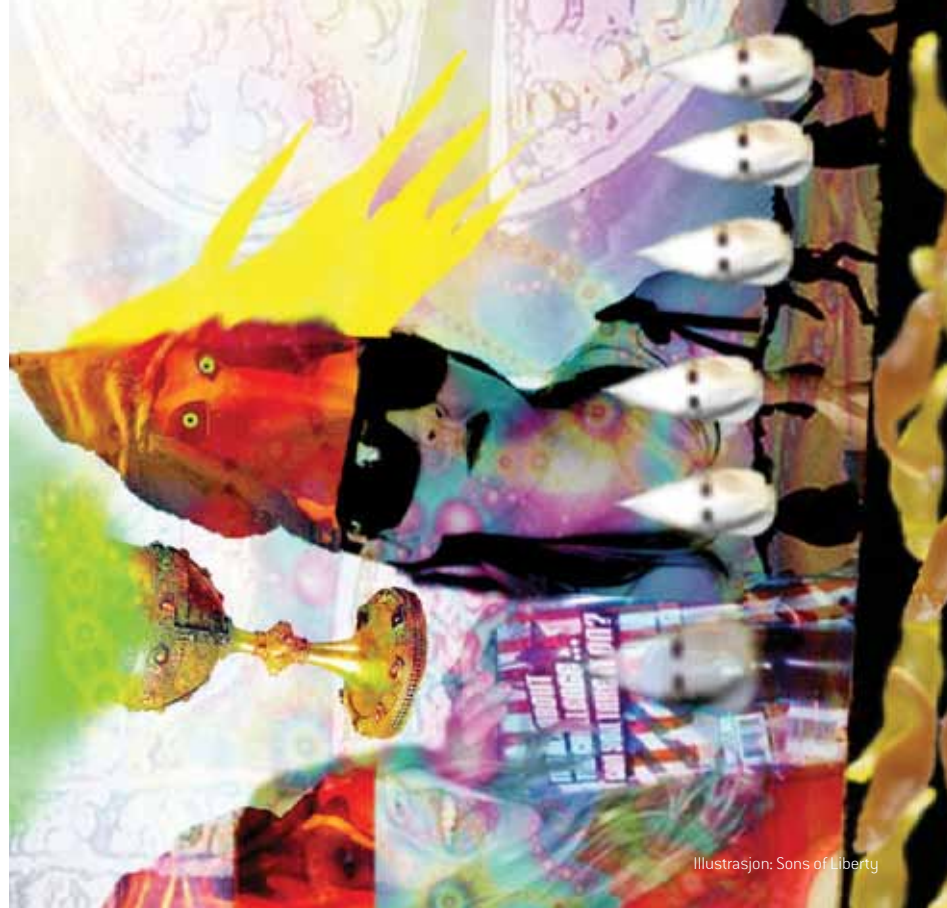
Illustrasjon: Sons of Liberty

"VILL VI SÅ MYCKET, VI ÄLSKAR ÄH OCH ALLT MÖJLIGT OCH BARA LITA PÅ DET VÖLKER, SLAPPNA HANDEL, LUTA ÄH TILLBAKA OCH, DAS DER LIEBE GLAUBT.