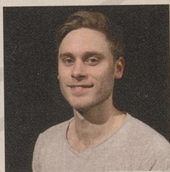
CHRISTIAN HESTØ: Lucio, Julius, Kling