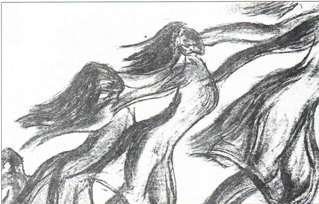
Tegnet av Rita Bondestad Høgtun videregående skole -96

Dere talte i et nytt språk for oss: dans og musikk. Dere gjorde det vakkert og morsomt, med følelse og stil, engasjerende og betagende. Det lå stor faglig dyktighet bak forestillingen og den pedagogiske utfordringen taklet dere suverent. Harestua ungdomsskole