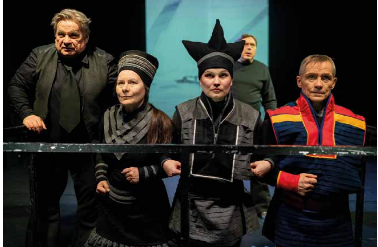
Govern/Foto: Aslak Mikal Mienna