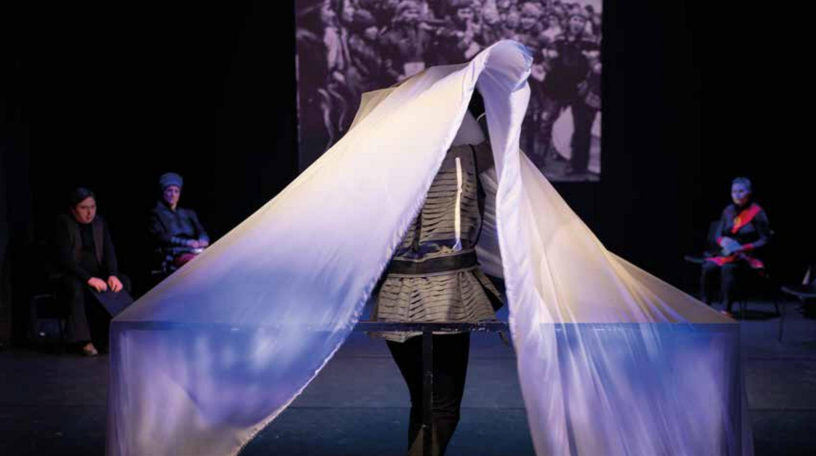
Goveren/Foto: Aslak Mikal Mienna