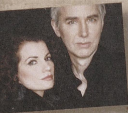
Ekteparet Ahndoril med psevdonymet Lars Kepler står i spissen for over 45 krimforfattere som kommer til Krimfestivalen.