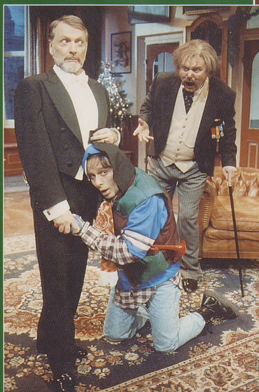
Sir Drake: Hvor lenge...? David: Dette er privat!