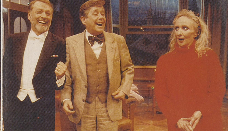
Hubert: Strutter ikke akkurat!