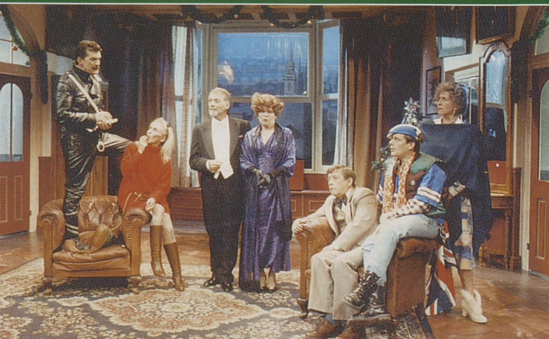
Konstabelen: Jeg vil ha svar på samtlige spørsmål!