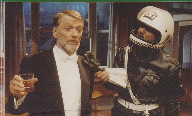
Konstabelen: Jeg er ute etter en ung mann, Sir. David: En spesiell ung mann - eller holder det at han er ung?