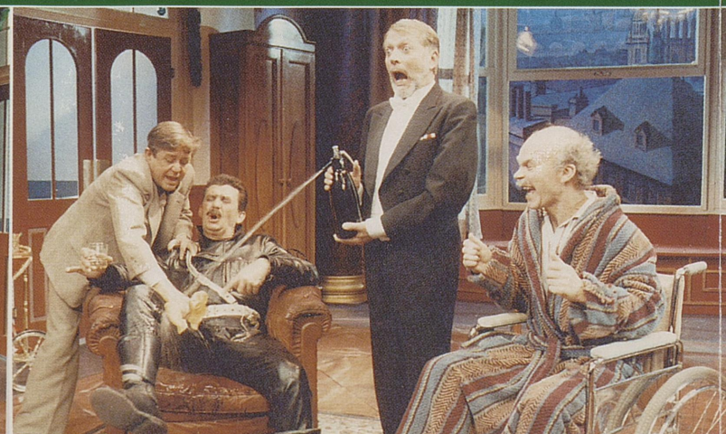
Bill: Kan jeg få sprute nå?