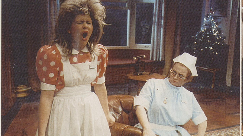
Oversøster: Har du hørt om en Mr. Lesley? Sykepleiersken: Kan ikke huske det navnet.