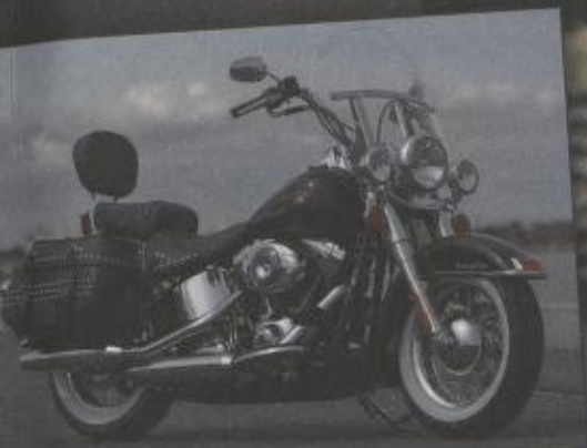
FLSTC HERITAGE SOFTAIL® CLASSIC