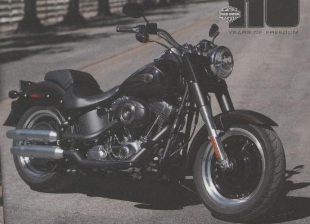
FLSTFB FAT BOY® SPECIAL