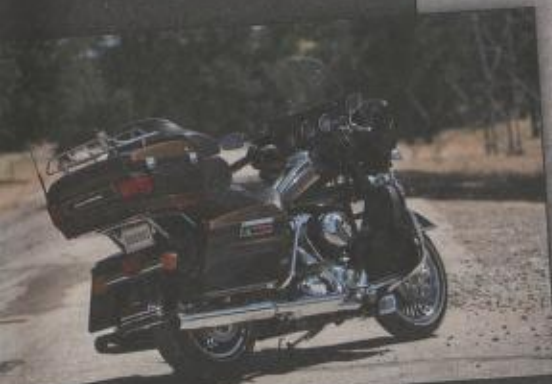
FLHTK ELECTRA GLIDE® ULTRA LIMITED