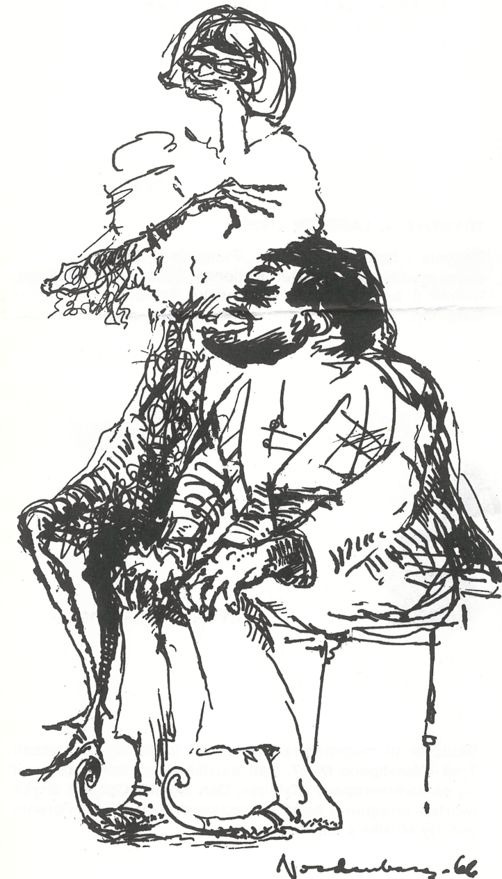
CHRYSALE OG BELICE