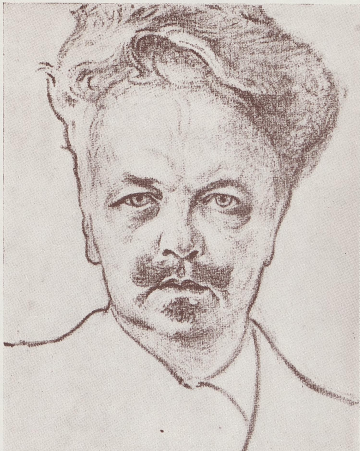
AVG. STRINDBERG FVRVSVD. JVLII. 1899. RITADT AF HANS GAMLE VÅN. O.L.