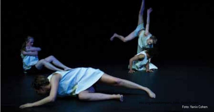
esc ungdomskompani. Foto: Yaniv Cohen Foto: Yaniv Cohen

DANS TIL FOLKET - ET DOGMEDANSPROSJEKT- ER ET LITE TILSLØRT FORSØK PÅ Å DELVIS KOPIERE DET GREPET DOGME 95 LANSERTE UNDER FILMFESTIVALEN I CANNES I 1995 OG RETTE SØKELYSET MOT DEN I ORDETS RETTE FORSTAND FRIE OG IKKE-KOMMERSIELLE DANSEN I NORGE IDAG.