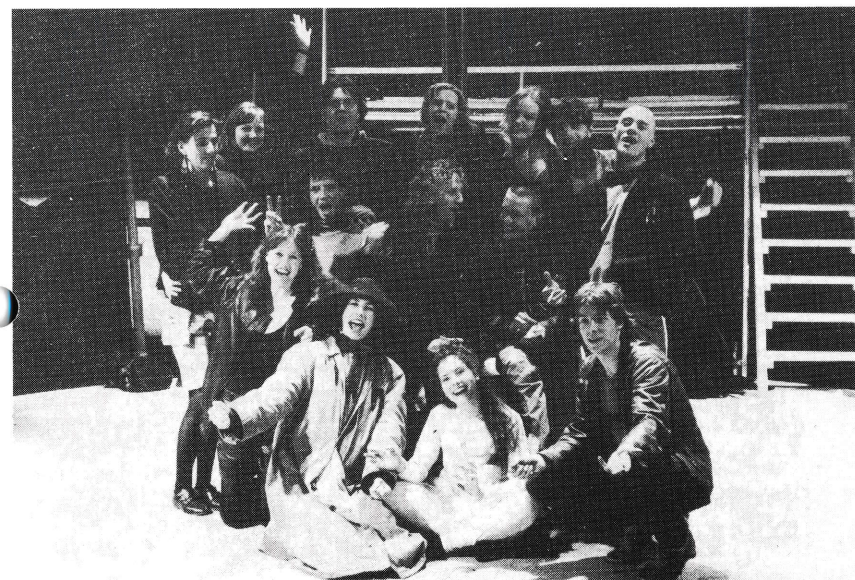
Bilde fra prøvene.