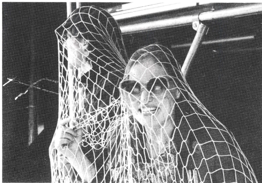
Bilde fra prøvene.