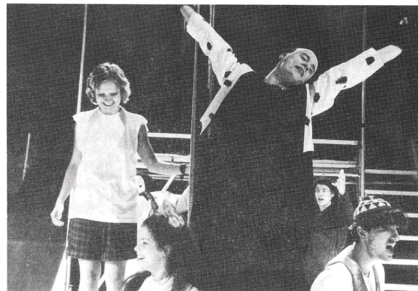
Bilde fra prøvene.