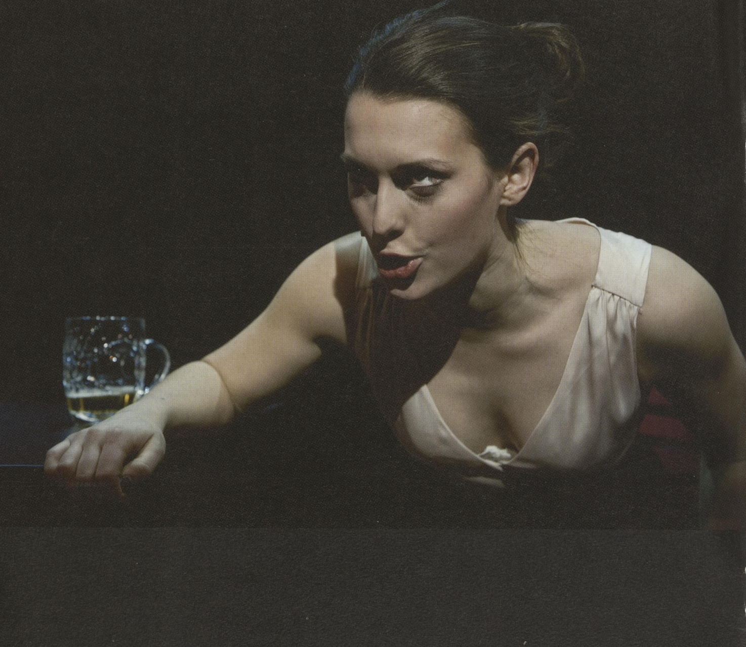
Bildet er tatt i prøveperioden