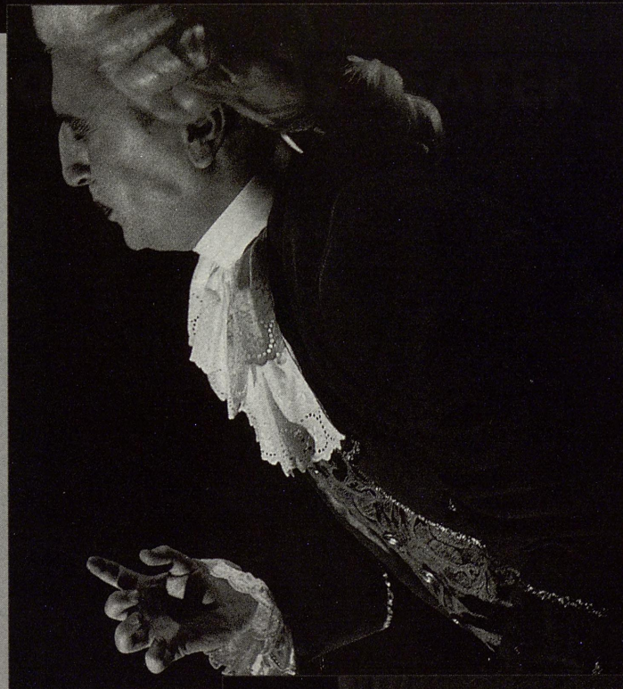
plakat Mette Kirksæther • programredaksjon Lars Øyno, Kari Lise Kolås • layout Kari Lise Kolås • trykk Falch Fargestrykk

Framsyinga er støtta av Norsk Skuespillerforbund, Norsk Kassettagiftsfond, Fond for Utøvende kunstnere og Norsk Kulturfond.