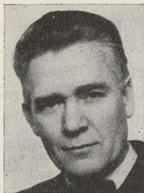
Harald Heide Steen