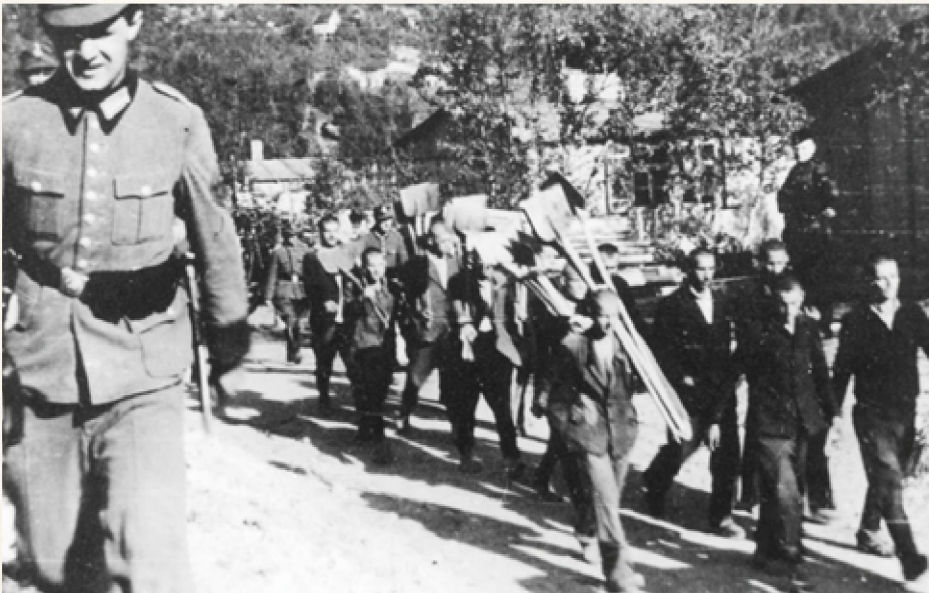
Foto: SS Vaktbataljonen og tvangsarbeidere på anlegg i Nord-Norge

Angrepet på Herøya den 24. juli var det første toktet i «Operation Blitz Week», den mest intensive bombekampanjen til da. Målet var først og fremst å ødelegge grunnlaget for tysk jagerflyproduksjon. I «Blitz Week» inngikk ellers mange mål i Nord-Tyskland de nærmeste dagene, som Focke-Wulf-fabrikken ved Oschersleben, men også terror-bombingen av Hamburg (Operasjon «Gomorra»).