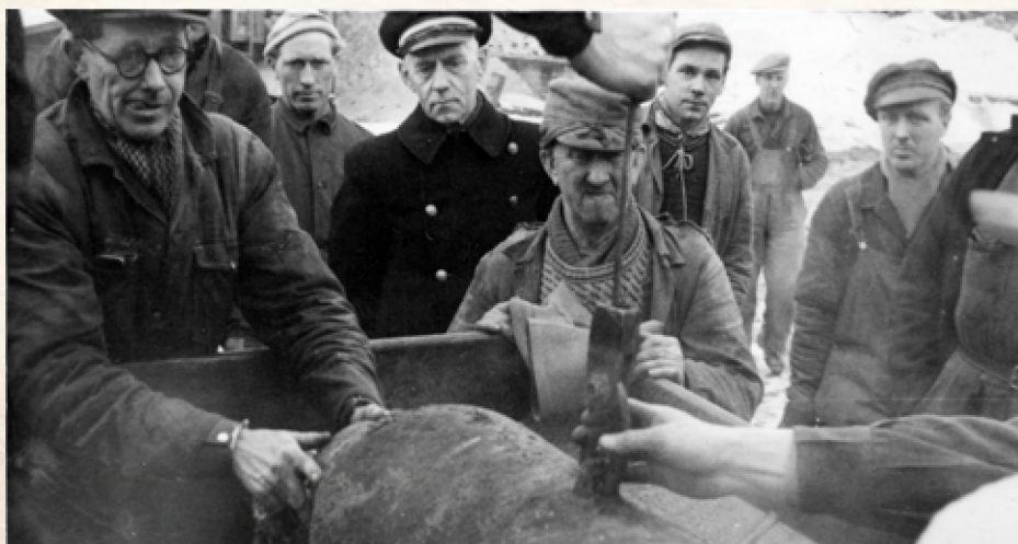
Foto: Arbeidere på Herøya desarmerer en bombe.

Det samme skjedde med Oslo-konsortiet, som fikk beholde sine aksjer. «Investorene i Oslo-konsortiet representerte det norske industriborgerskapet.