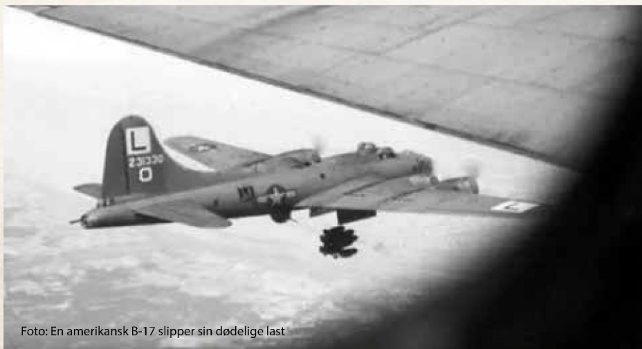
Foto: En amerikansk B-17 slipper sin dødelige last

De allierte regnet toktet mot Herøya som meget vellykket. Motstanden fra tysk luftvernild var minimal og kun ett fly gikk tapt. Det nødlandet i Sverige uten tap av menneskeliv. Det var ellers ingen selvfølge. 8th Air Force skal ha hatt de høyeste tapstallene blant amerikanske stridsheter i Europa.