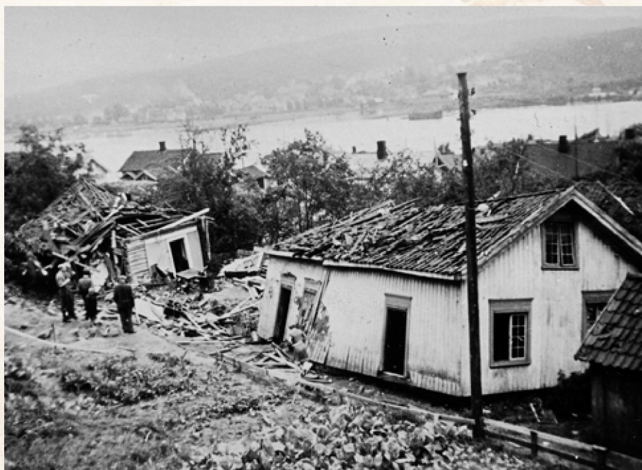
Foto: Fra Knardalsstrand der en 10-årig jente ble drept