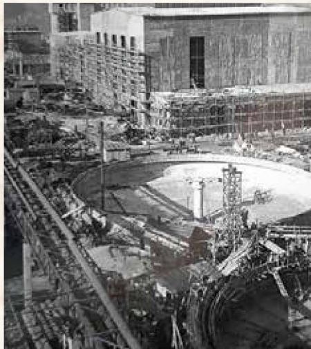
Foto: Fra byggingen av magnesiumfabrikkene