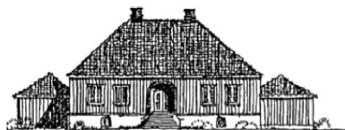
Uten fortid - ingen fremtid

Dette er historisk grunn, byens arnested. Porsgrunns museene og Grenland Friteater er to viktige kulturbærere som samarbeider i Porsgrunn.