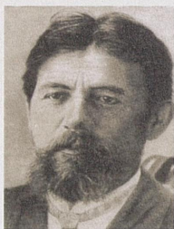
Siste foto av Anton Tsjekhov, 1904.

dybde i å beskrive karakterer var et tegn på at han ville utvikle seg til å bli en seriøs skjønnlitterær forfatter.