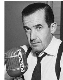
Edward R. Murrow