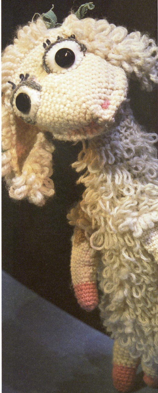
Ellen Horn, Teatersjef Riksteatret

A stylized, handwritten signature of Ellen Horn in black ink.