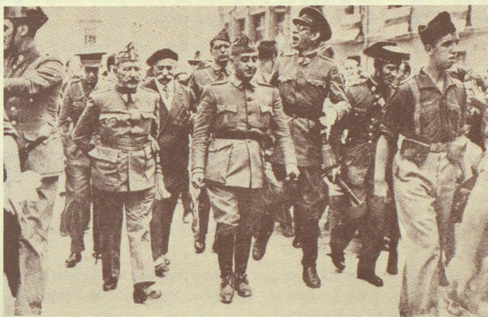
Generalane, — Francisco Franco marsjerer i midten.

Borgarkrigen tok til da ei gruppe generalar, mellom dei Francisco Franco, gjorde opprør mot den lovleg valde regjeringa i landet. Kuppet var nøye planlagt av generalane som i fleire år hadde arbeidd for å gjera hæren til eit reidskap for føremålet sitt. Dette lukkast avdi landet tradisjonelt hadde ein sterk og reaksjonær offiserstand og avdi den liberale regjeringa æva seg for å gå til utrensingar. Juntaen hadde òg skaffa seg herredøme over ei rad viktige våpenarsenal. Målet var «å gjenopprette lov og orden» — dvs. skape eit militærdiktatur etter fascistisk mønster. Inngrep var naudsynt «for å hindre kommunistisk statskupp», sa Juntaen. Men sanninga var at kommunistane ikkje hadde nokon dominerande plass i spansk politikk. Dei hadde 16 av 277 plassar i Cortes, og var ikkje representert i regjeringa før krigen braut ut. Likevel var det mange, både i og utanfor Spania, som let seg skræme av «den raude faren».