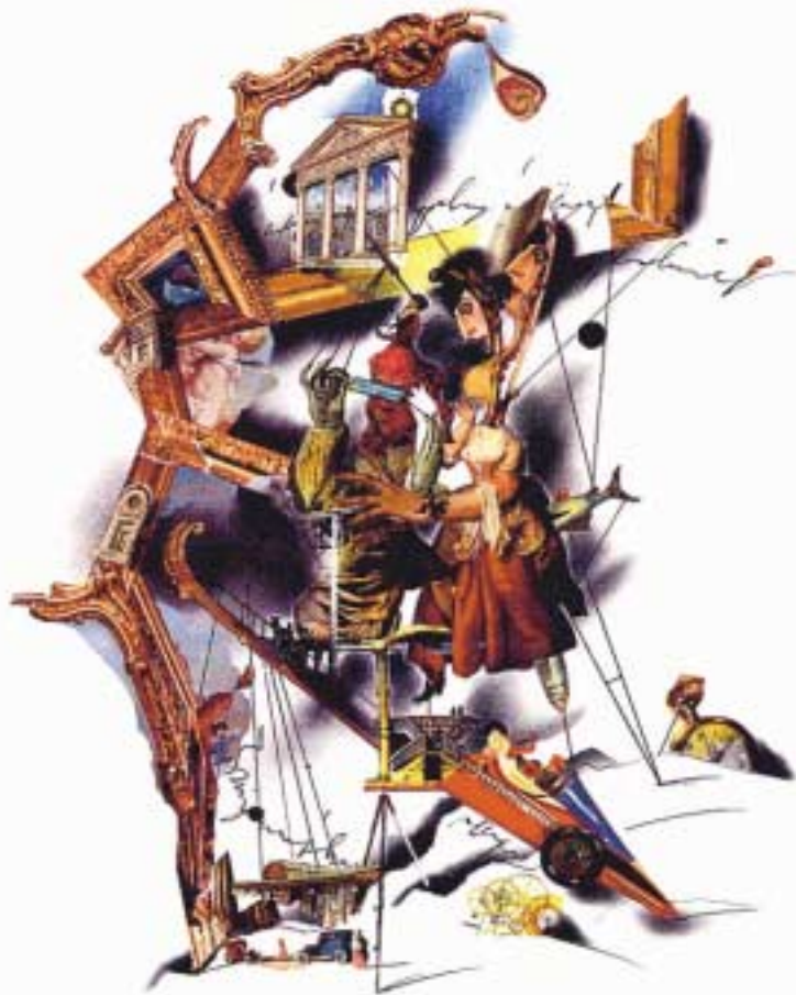
Illustrasjon: Mr. Nobutaka Kofake

29-30 SEPT / 01 OKT KL 20:00 BIT TEATERGARASJEN 155,-/75,-