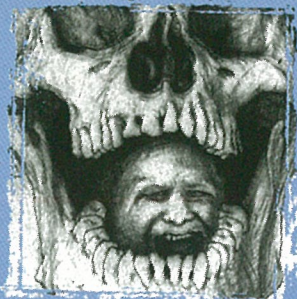
Bilde: Arne Bendik Sjur