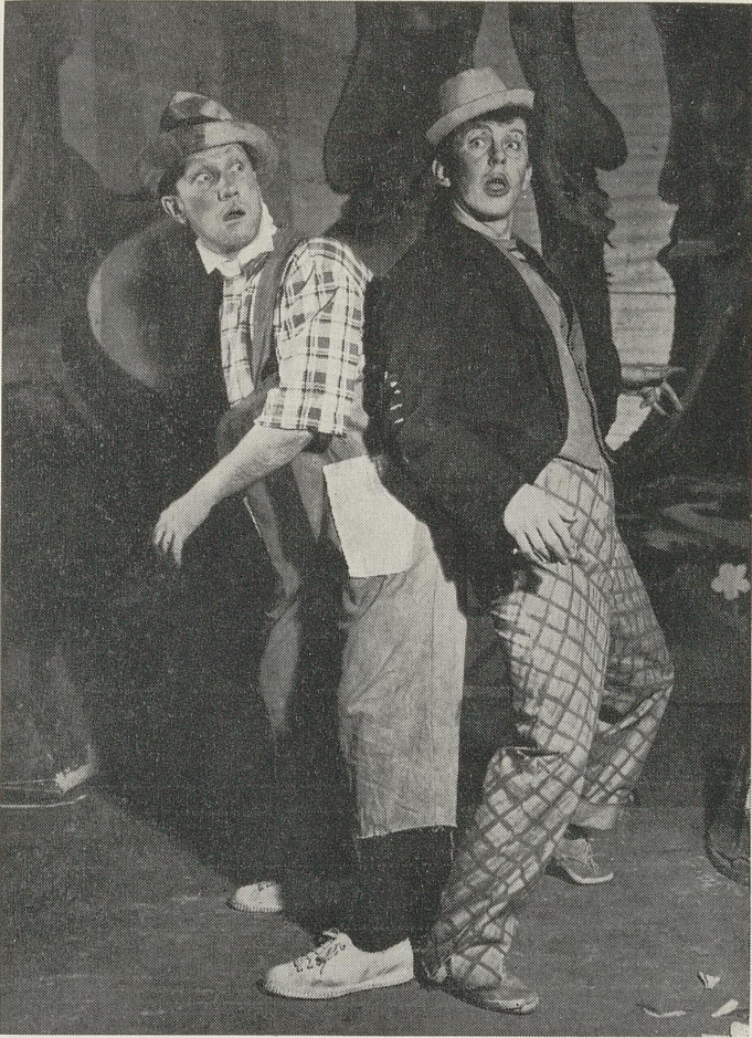
Flickr og Flakk i Latterskogen