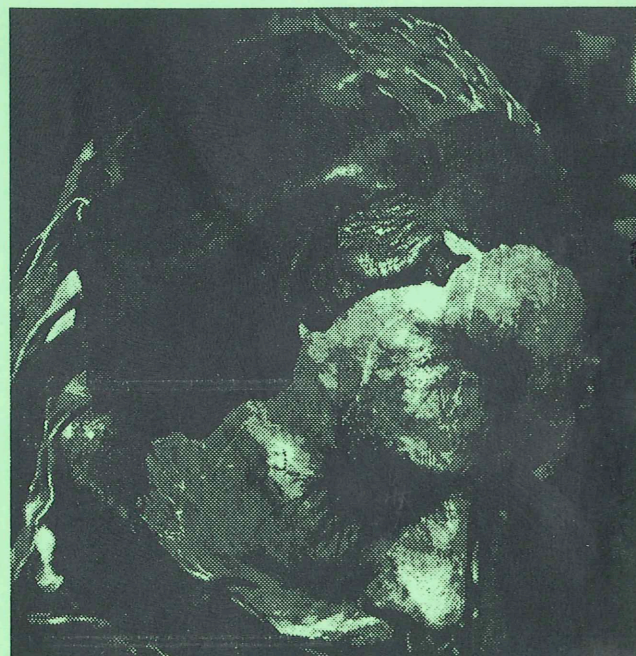
Fra I Domarens Skepnad

Forsalg: Kulturhuset USF og Bergen Kino alle dager 11.00 - 23.00