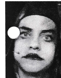
Bullie: Henriette Steenstrup

Baglady som har sett det meste her i livet. En god sjel som gjerne trøster de andre hundene når tilværelsen i hundgården blir for jævlig. Har stort nettverk og muligheter til å smugle varer innenfor gitteret.