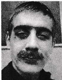
Preach: Pål Sverre Valheim Hagen

Foreldrene fra Skottland ble tvungen til å gjøre kunster ved sirkus. Da Table Top Joe ble født under en turne i New York, ble han etterlatt under Brooklyn Bridge. Ingen visste da at han ble født med defekte bakben. Bitch fant ham.