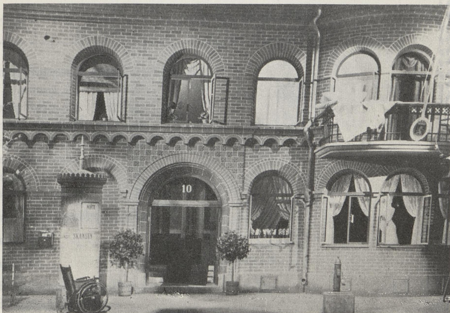
Dekorasjon til I akt i «Spøksonaten»