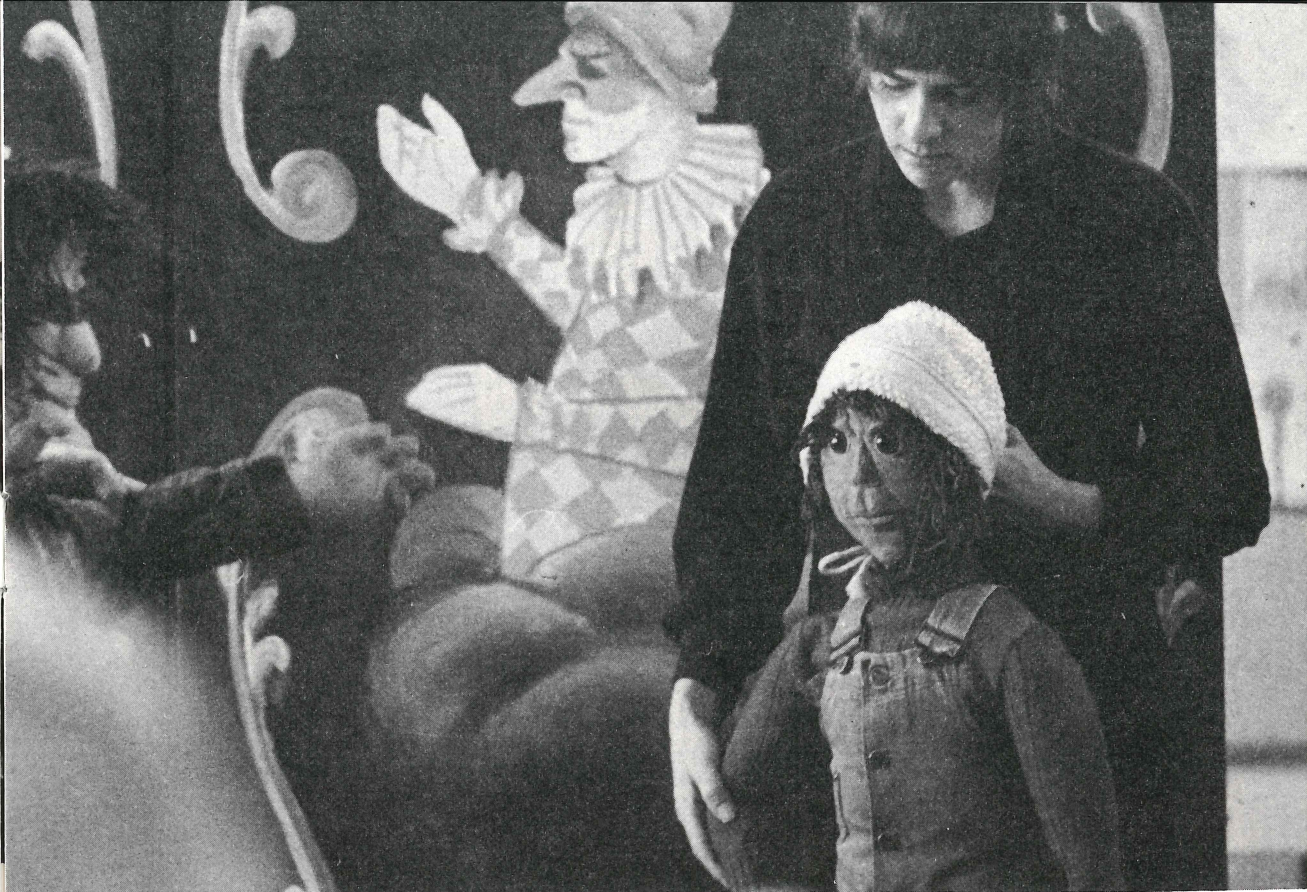
Fra "Hjemmebarn og Fremmedbarn".