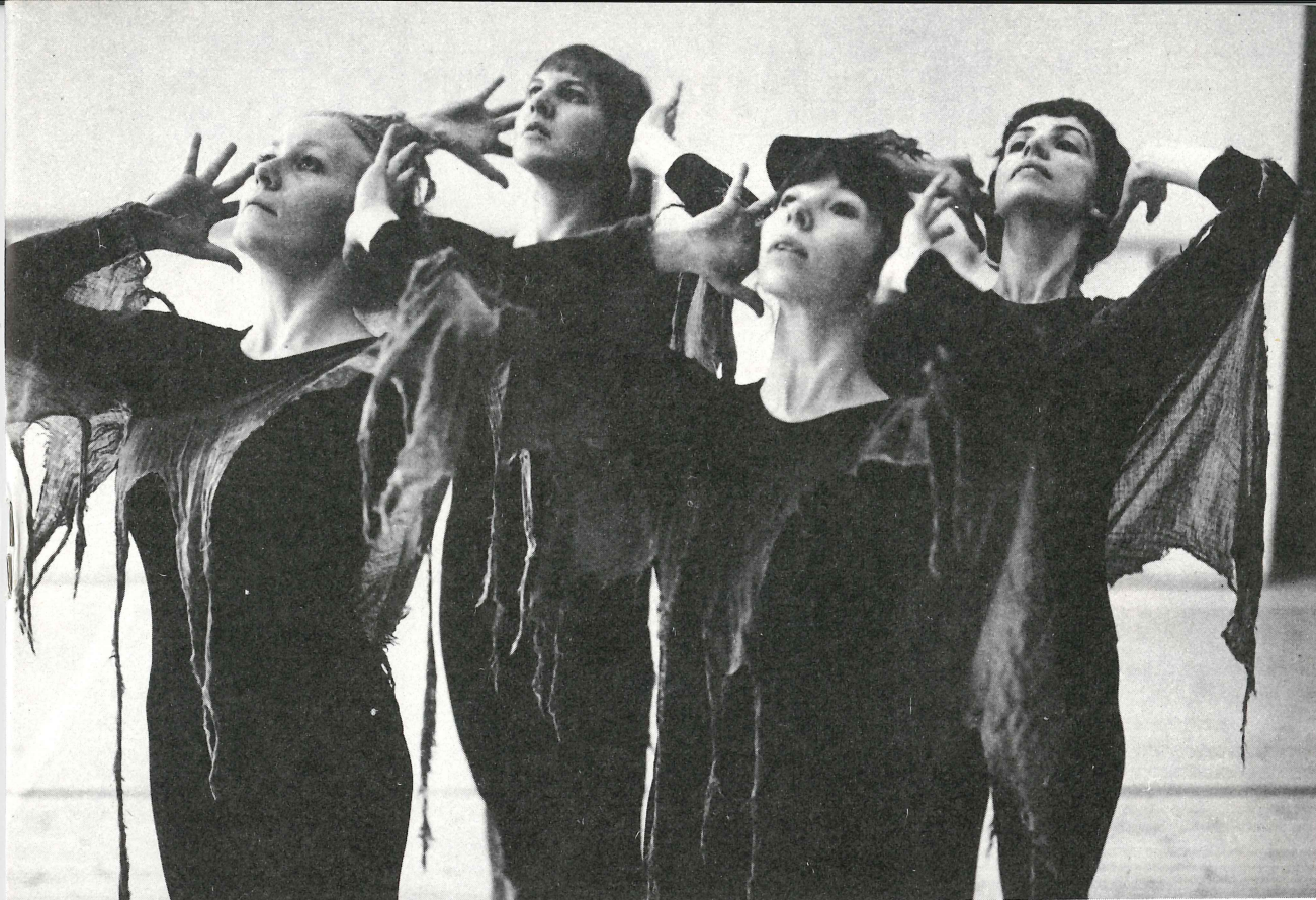
Fra "Som trær alene i skogen"