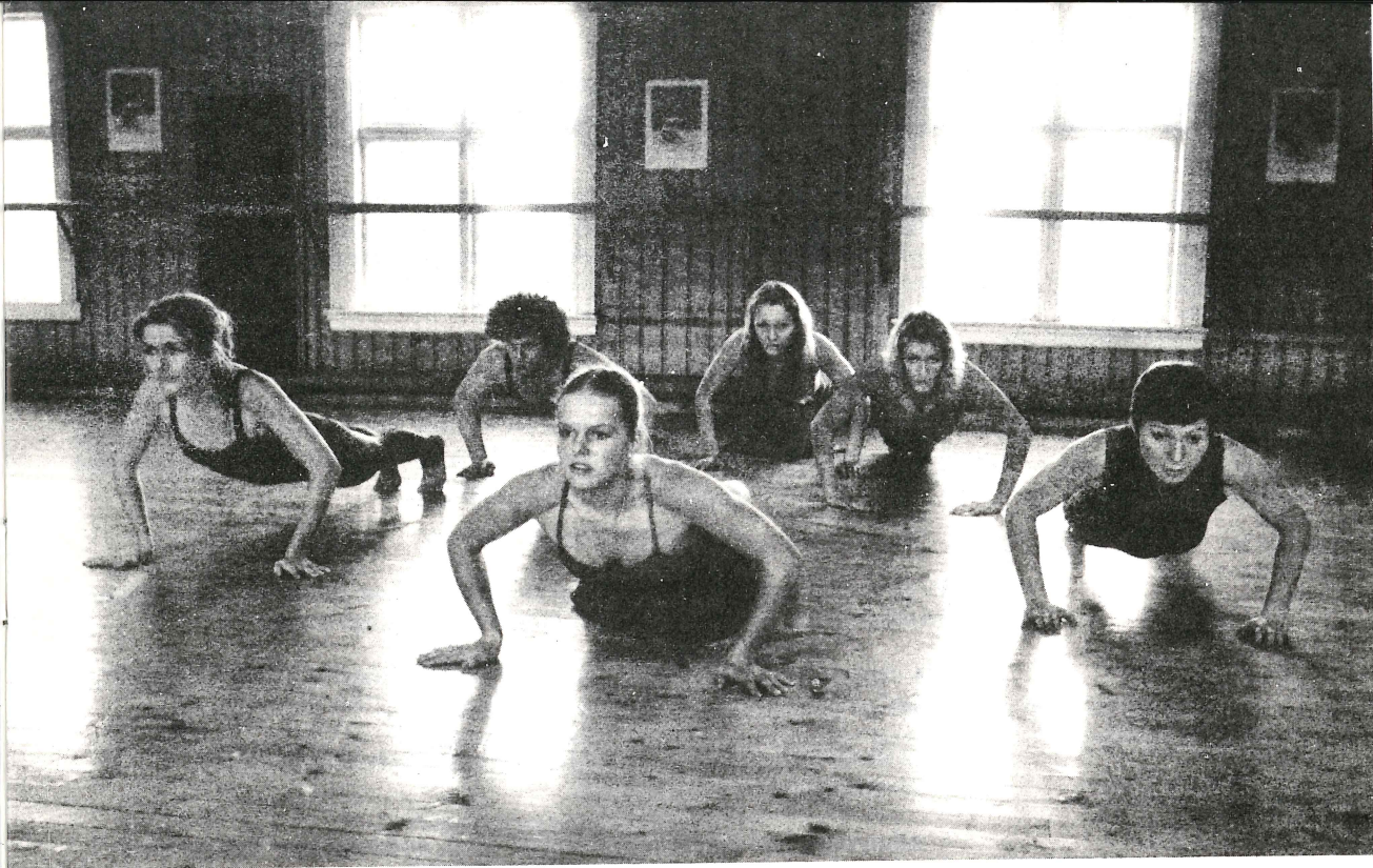
Fra "Strømninger".

"SÅ BEINHARDT ER MILJØET BLITT AT HVA SKULLE DENNE UNGJENTA I DETTE SELSKAPET, LIVET GÅR VIDERE MED ELLER UTEN BLOMS- TER OG I VASKEN"