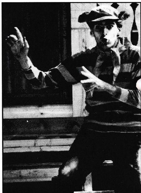
Reven har en genial plan.