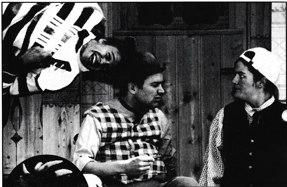
Klatremus, Bamsefar og Morten Skogmus.