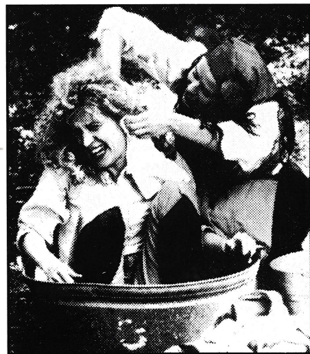
Bamsemor vasker Brumlemann.