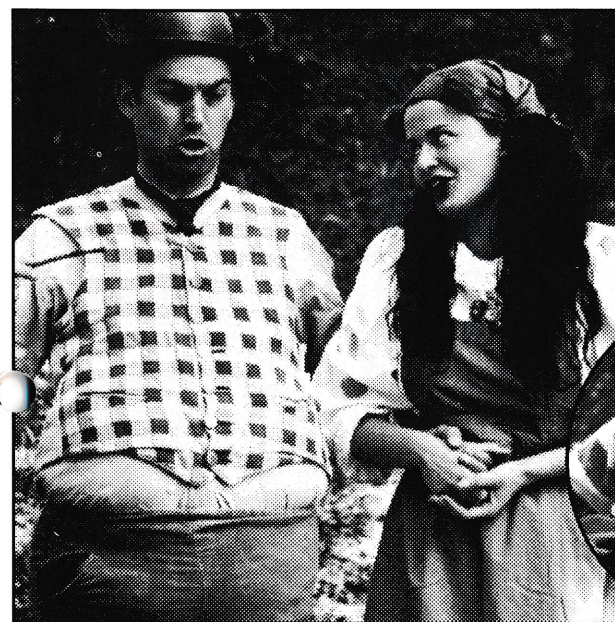
Bamsefar og bamsemor synger grønnsakspiservisa.