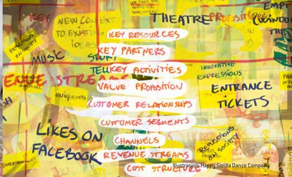
Illustrasjon: Happy Gorilla Dance Company