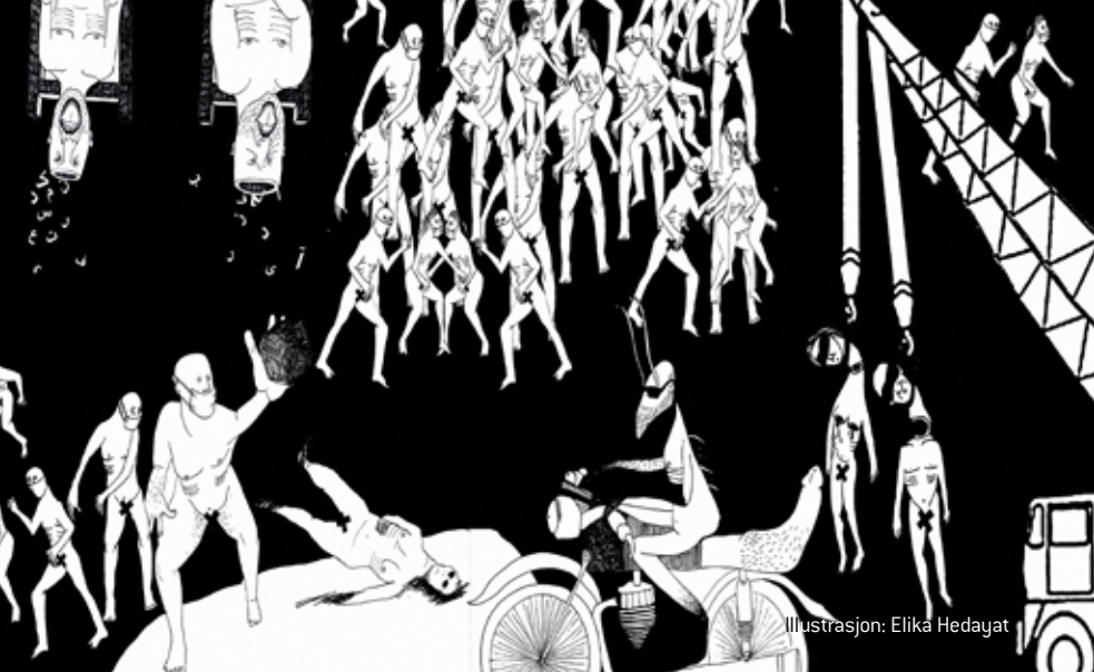
Illustrasjon: Elika Hedayat