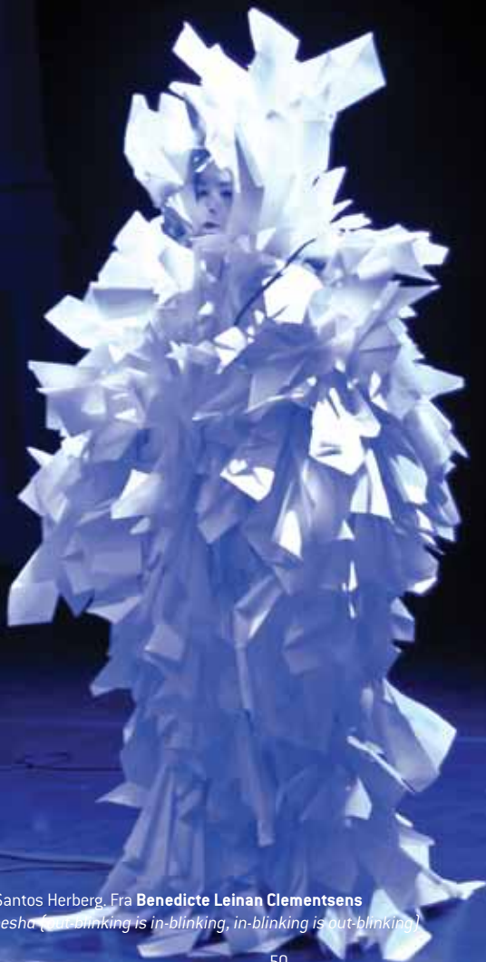
Fra Benedicte Leinan Clementsens Unmesha Nimesha ( not blinking is in-blinking, in-blinking is out-blinking )

3. september – Chagall 17. september – Nobel Bopel 1. oktober – KNIPSU 21. oktober – Oktoberdans: Logen Teater – PrøveRommet – dans! 5. november – Kafe Krystall 19. november – BIKS 3. desember – Bergen Kjøtt ☉ 20:00 – 01:00