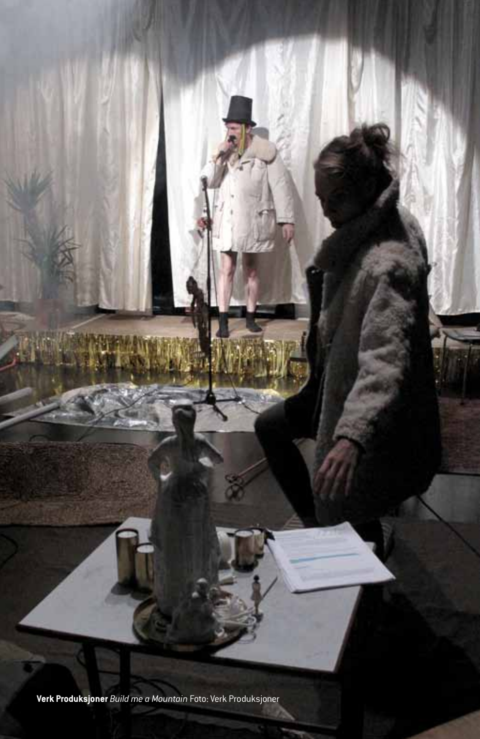
Verk Produksjoner Build me a Mountain