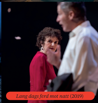
Lang dags ferd mot natt (2019)