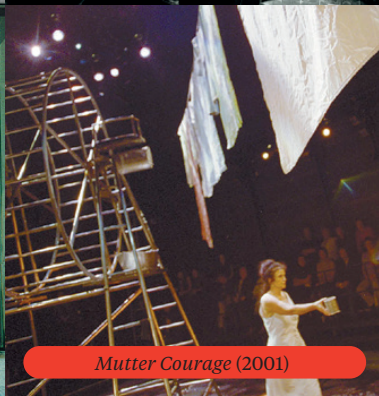
Mutter Courage (2001)