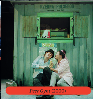
Peer Gynt (2000)