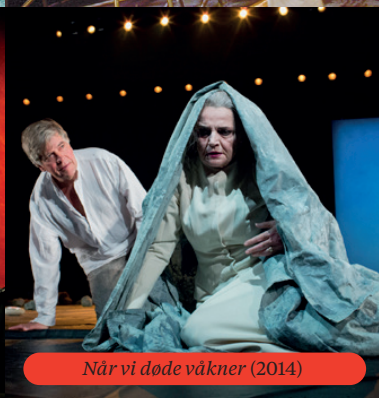
Når vi døde våkner (2014)