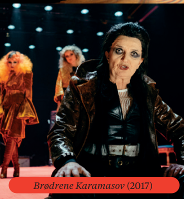
Brødrene Karamasov (2017)