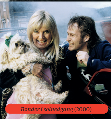
Bønder i solnedgang (2000)