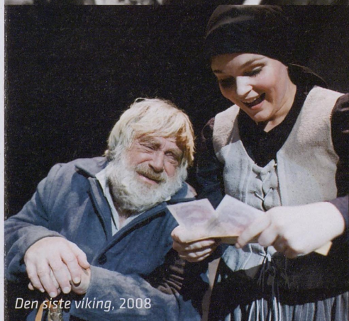
Den siste viking, 2008