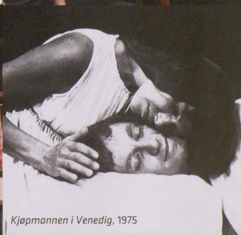
Kjøpmannen i Venedig, 1975