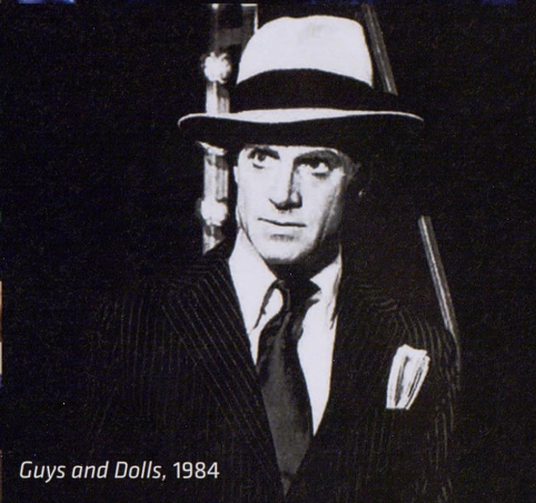
Guys and Dolls, 1984