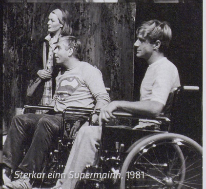
Sterkar einn Supermann, 1981