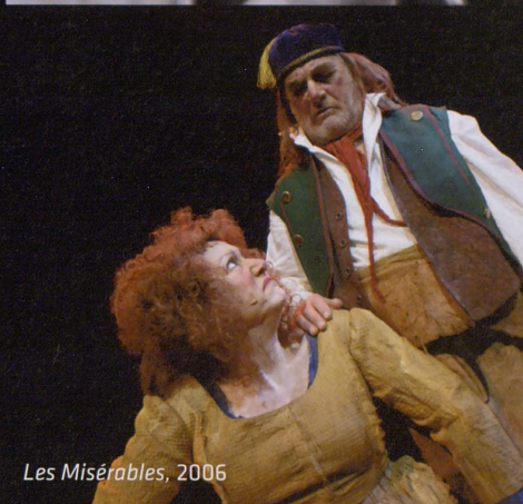
Les Misérables, 2006