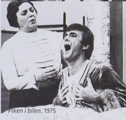
Piken i bilen, 1975