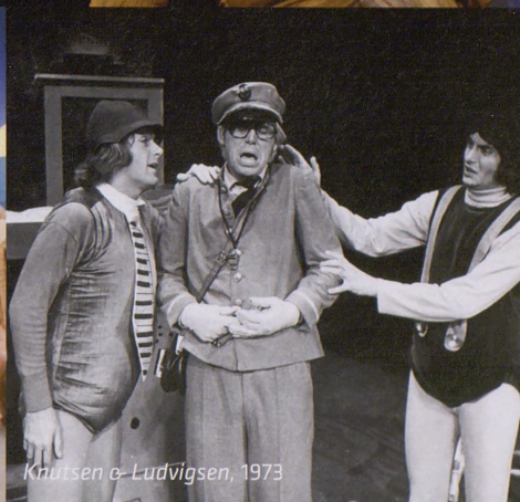
Knutsen & Ludvigsen, 1973