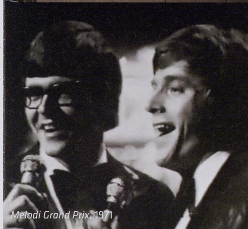
Melodi Grand Prix, 1971