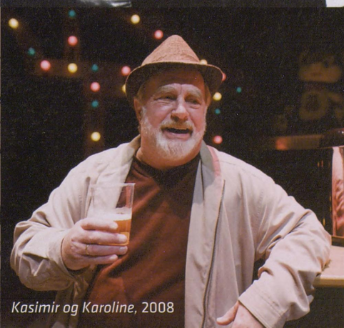
Kasimir og Karoline, 2008