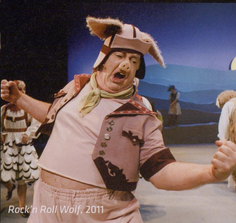
Rock'n Roll Wolf, 2011