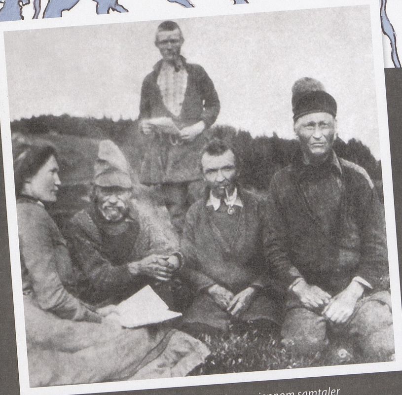
Elsa Laula Renberg talte samenes rettigheter gjennom samtaler og sin bok «Inför Lif eller Död».