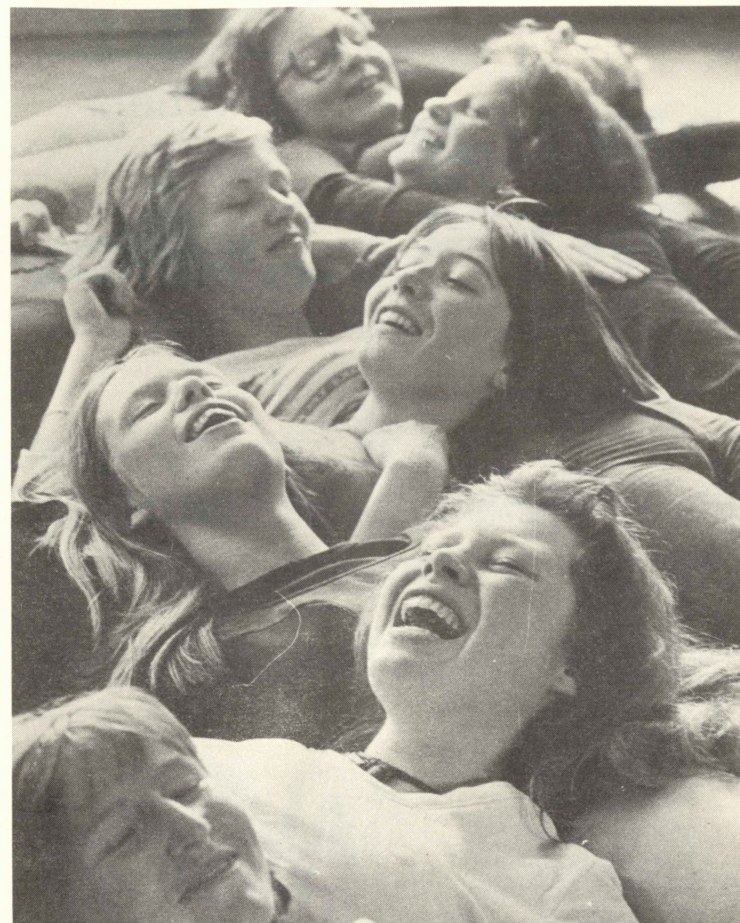
Psykodrama i deltidsgruppen.

As recently as Spring 1976 we have worked with the youth section of the Thesbi Teater, who put on the production as part of the British Cultural Week we arranged in conjunction with Stovner Senter outside Oslo.