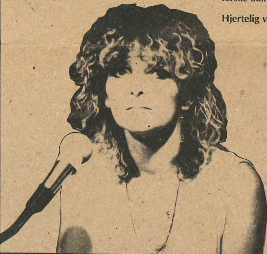
◀ Fra «Gipsy Celebration»