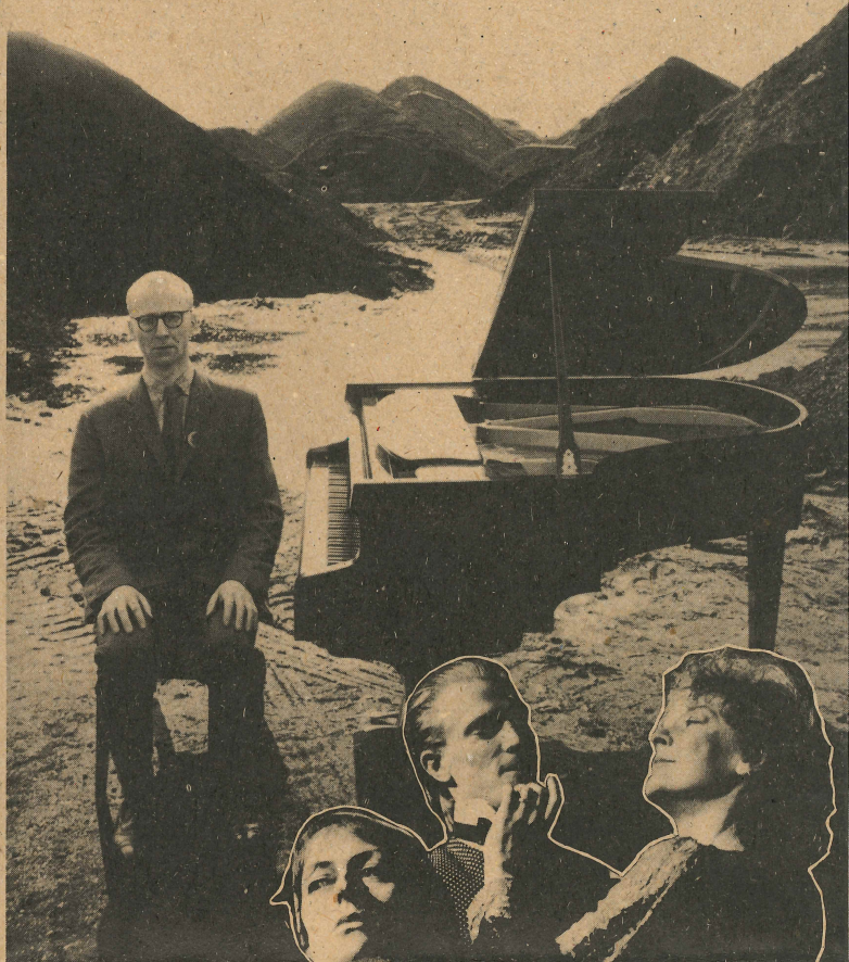
△ Fra «Boychild»