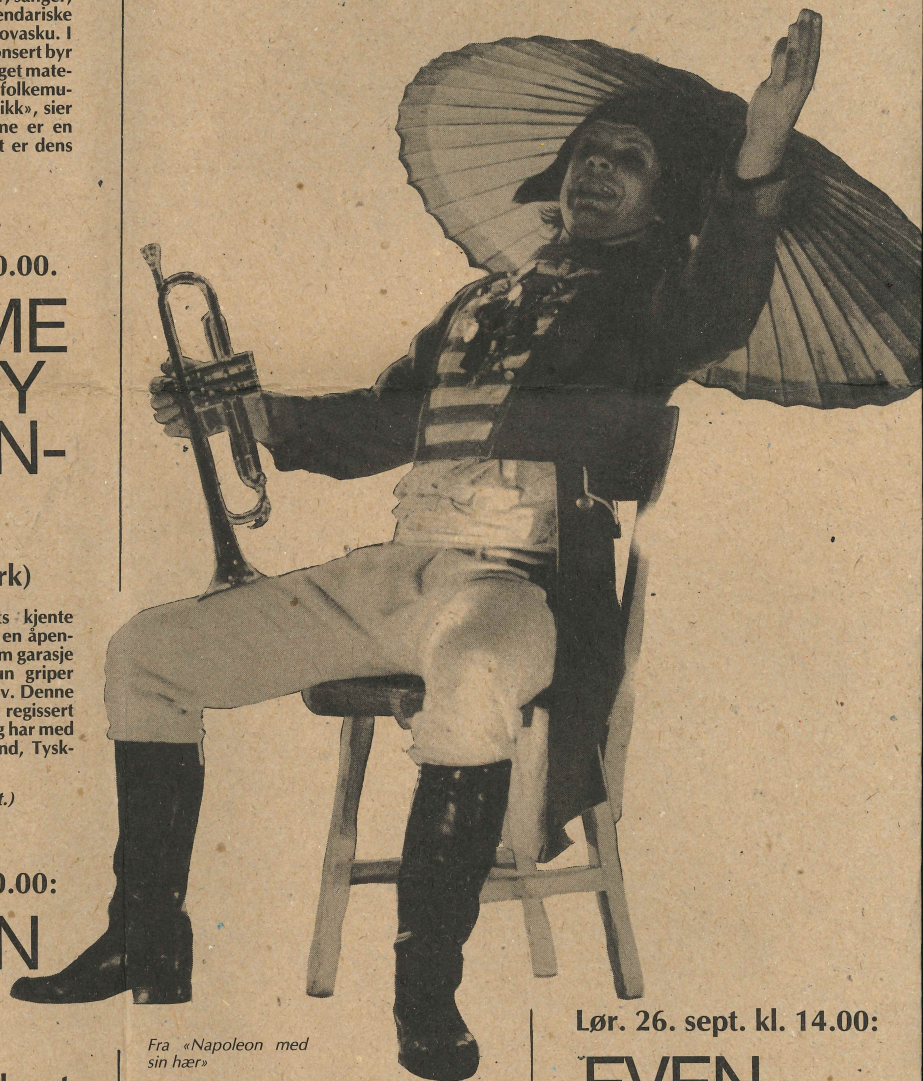
Fra «Napoleon med sin hær»

(Voksenforestilling. Delvis polsk tekst.)