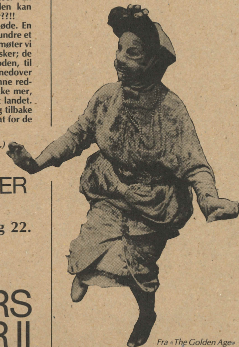
Fra «The Golden Age»

Fre. 11., lør. 12 og søn. 13. des. kl. 20.00: