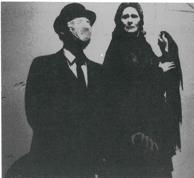
A Traveling Jewish Theatre